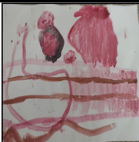
Obr. 1 -3: Torta - prvá variácia