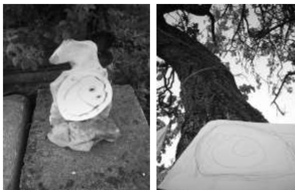
Fotografie č.1 a 2.