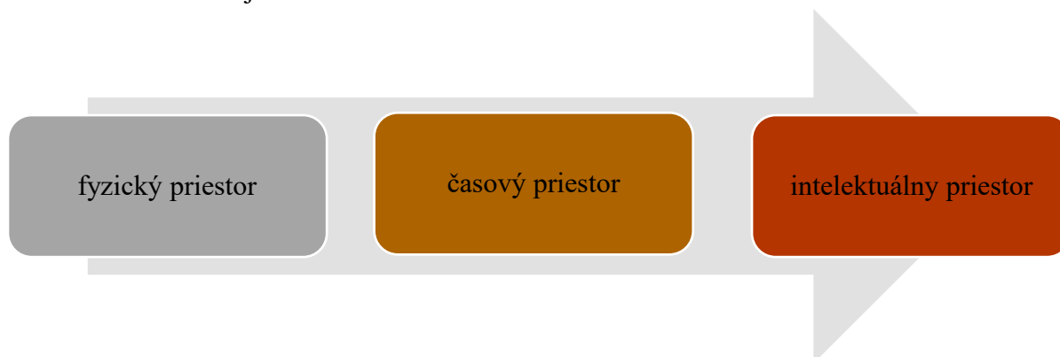
Schéma 1 Priestor a jeho dimenzie